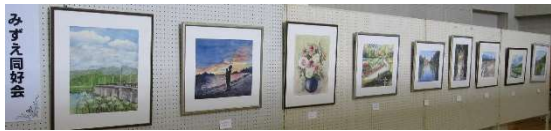
○見事な作品が揃っていました。郷土愛にあふれてとても良かったです。(水彩画)