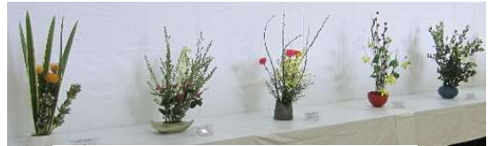
○友の生け花、素晴らしいですね。