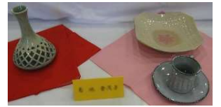
○どれも心のこもった作品でした。(陶芸)