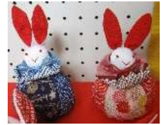
○つるし雛、すごく楽しませてもらいました。