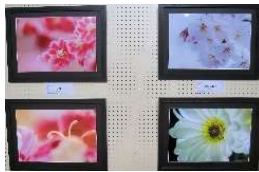
○「写心」感動しました。