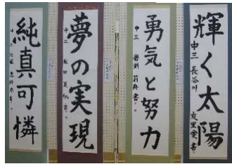
○参加者が多く、熱心さがありました。 ○書道の作品は良いですね。