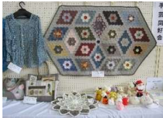
○手あみベスト、パッチワーク、すばらしいです。