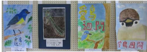
○鳥がかわいい。雀の大きな顔に思わず笑いがこぼれました。(前小児童作品)