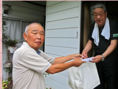
前沢南地区自治振興会