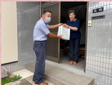
白鳥地区住民協議会