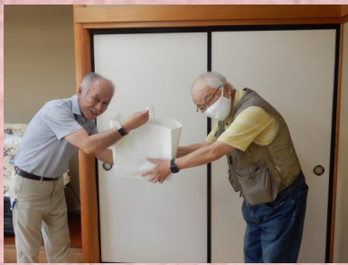
前沢中央地区自治振興会