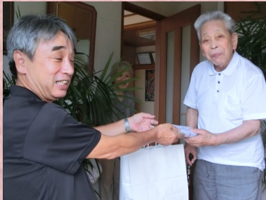
前沢東地区振興会

今年も、前沢中学校2年生による職場体験学習が敬老事業の時期と重なり、お祝品の袋詰め作業などのお手伝いをしていただきました。