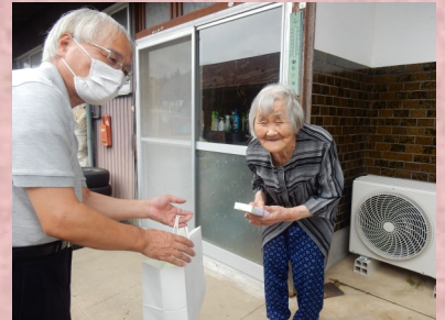
上野原地区振興協議会